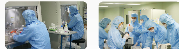
細胞培養センター