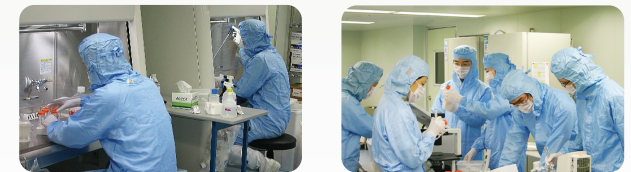
当院併設の細胞培養センター